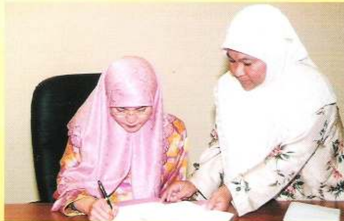
Yang Teramat Mulia Paduka Seri Pengiran Anak Puteri Hajah Majeedah Nuurul Bulqiah ketika berkenan meneliti surat pertanyaan hukum yang diterima melalui e-mail untuk proses menjawab pertanyaan tersebut.