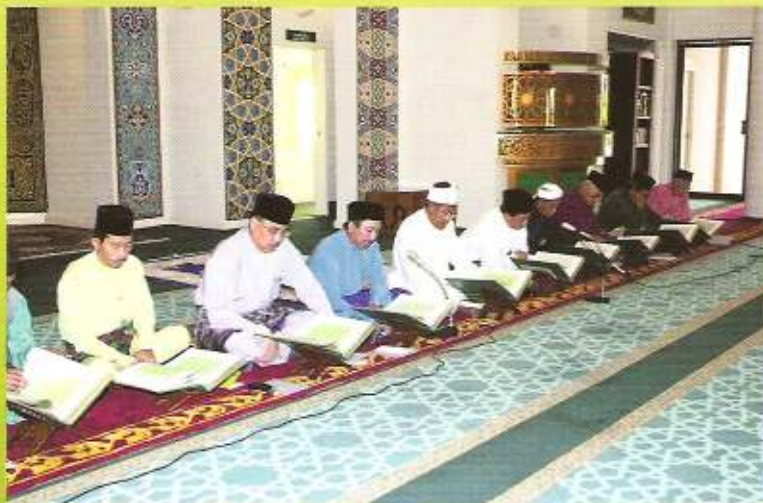
Majlis Tadarus di Masjid Kampong Pintu Malim.