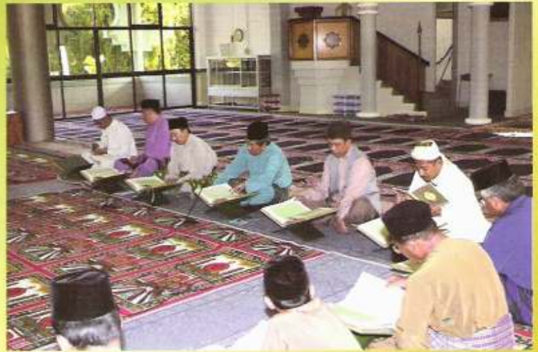
Majlis Tadarus di Masjid Kampung Limau Manis.

Majlis Khatam al-Qur'an bagi tadarus tersebut telah diadakan di Masjid Al-Ameerah Al-Hajjah Maryam, Kampung Jerudong, pada 11 Ramadhan 1422 bersamaan dengan 27 November 2001. Majlis tersebut dimulakan dengan bacaan surah al-Fatihah yang diketuai oleh Yang Dimuliakan Lagi Dihormati Pehin Mufti Kerajaan seterusnya bacaan surah-surah lazim secara beramai-ramai.