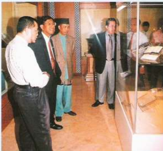
◀ Ketika mengadakan lawatan ke Balai Pameran Sultan Haji Hassanal Bolkiah.