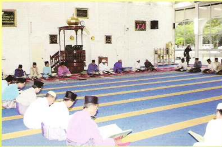
Majlis Tadarus di Masjid Setia Ali, Muara.