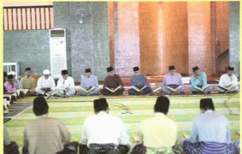
Majlis Tadarus di Masjid Perumahan Negara Lambak Kanan.