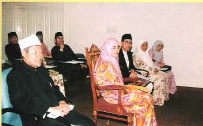
Yang Teramat Mulia Paduka Seri Pengiran Anak Puteri Hajah Majeedah Nuurul Bulqiah semasa menghadiri majlis halaqah ilmu.

Majlis halaqah ilmu diadakan ialah untuk mendapatkan maklumat lanjut mengenai sesuatu perkara daripada pakar dengan tujuan untuk menjadi bahan maklumat sebelum Mufti Kerajaan membuat ketetapan hukum. Bagaimanapun mufti tidaklah terikat dengan maklumat yang diperolehi.