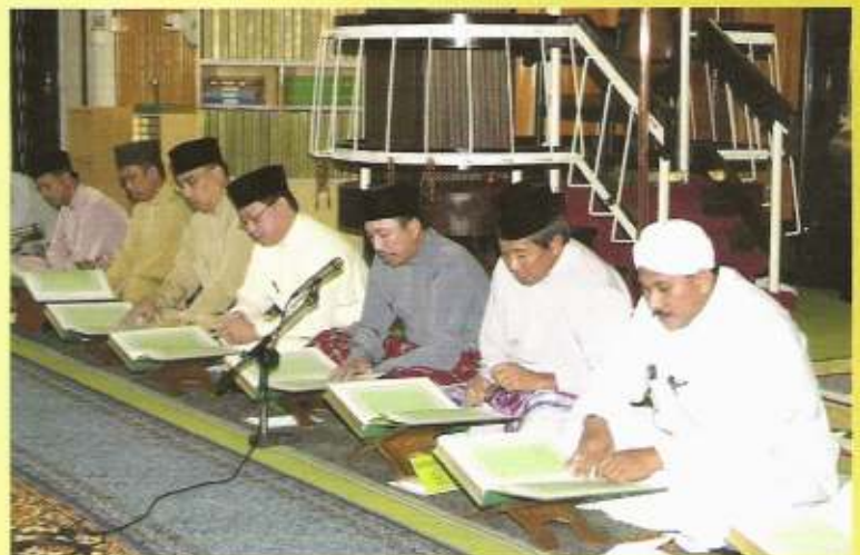
Majlis Tadarus di Masjid Kampung Beribi.