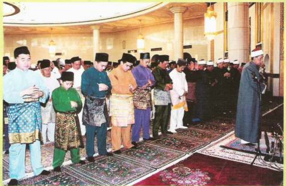
Kebawah Duli Yang Maha Mulia Paduka Seri Baginda Sultan Haji Hassanal Bolkih Mu'izzaddin Waddaulah, Sultan dan Yang Di-Pertuan Negara Brunei Darussalam menyertai rakyat dan penduduk negara ini menunaikan Sembahyang Sunat 'Idul Fitri di Jame' Asr Hassanil Bolkih.

2001, Kebawah Duli Yang Maha Mulia berangkat menyertai rakyat baginda menunaikan Sembahyang Sunat 'Idul Fitri di Jame' Asr Hassanil Bolkih.