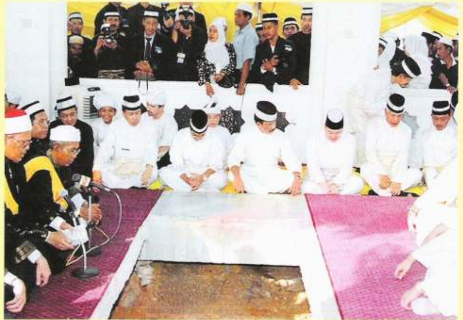
Kebawah Duli Yang Maha Mulia Paduka Seri Baginda Sultan Haji Hassanal Bolkiah Mu'izzaddin Waddaulah, Sultan dan Yang Di-Pertuan Negara Brunei Darussalam dan Duli Yang Teramat Mulia Paduka Seri Pengiran Perdana Wazir Sahibul Himmah Wal-Waqar Pengiran Muda Mohamed Bolkiah semasa memberikan penghormatan terakhir kepada Al-Marhum Sultan Salahuddin Abdul Aziz Shah Al-Haj, Yang Dipertuan Agong Malaysia.

Jenazah Al-Marhum kemudiannya diiringi menuju Istana Alam Shah, Klang, Selangor Darul Ihsan bagi