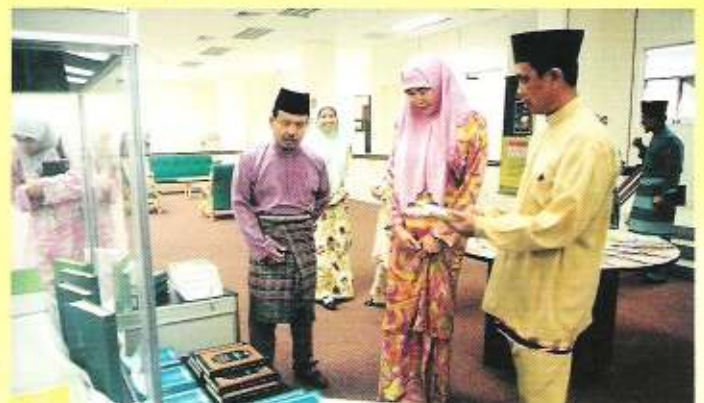
Yang Teramat Mulia Paduka Seri Pengiran Anak Puteri Hajah Majeedah Nuurul Bulqiah berkenan menyaksikan dengan lebih dekat lagi buku-buku terbitan Jabatan Mufti Kerajaan.