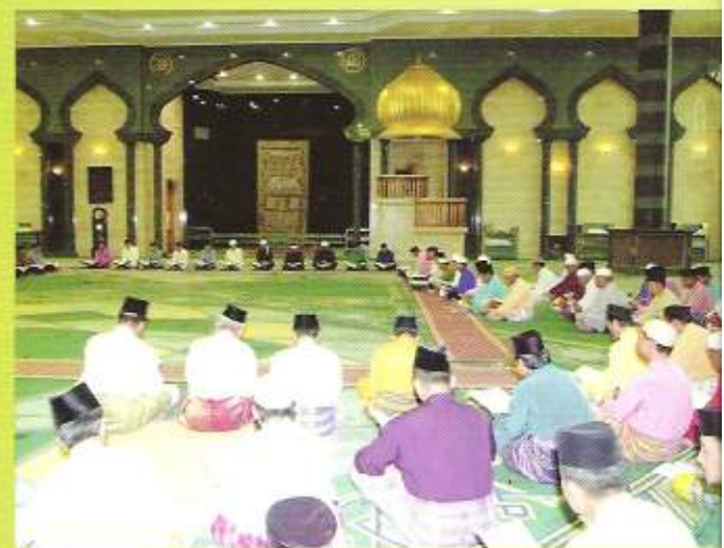
Majlis Khatamal Qu'an bagi tadarus Jabatan Perdana Menteri Hajjah Maryam, Kampong Jerudong. Di majlis itu Mufti Kerajaan masjid mithali.

Projek yang diadakan bagi kali keempat ini diselaraskan oleh Jabatan Mufti Kerajaan bersama Suruhanjaya Perkhidmatan Awam dan Jabatan Percetakan Kerajaan. Sebanyak 19 buah Jabatan termasuk Jabatan Perdana Menteri yang diketuai oleh Setiausaha-Setiausaha Tetap Kerajaan Jabatan Perdana Menteri telah dibahagikan kepada enam buah masjid yang dipilih bagi mengendalikan