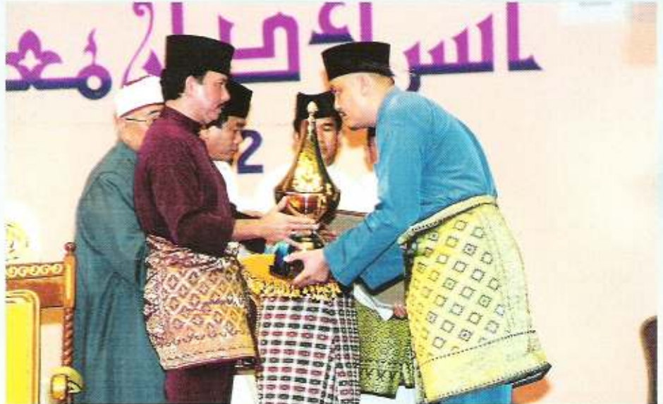
Kebawah Duli Yang Maha Mulia Paduka Seri Baginda Sultan Haji Hassanal Bolkiah Mu'izzaddin Waddaulah, Sultan dan Yang Di-Pertuan Negara Brunei Darussalam ketika berkenan mengurniakan hadiah bagi Anugerah Sekolah Ugama Teladan kepada wakil Sekolah Ugama Pantai Berakas.

sahaja menjanjikan kebahagiaan peribadi, malah juga untuk semua warga dunia. Ia akan menapis dan menghalangi segala anasir negatif. Ia tidak akan membenarkan walau sejangkalpun sebarang anasir daripada bergerak untuk mengharu-birukan kehidupan.