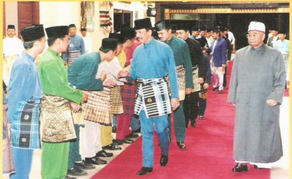
Kebawah Duli Yang Maha Mulia Paduka Seri Baginda Sultan Haji Hassanal Bolkiah Mu'izzaddin Waddaulah, Sultan dan Yang Di-Pertuan Negara Brunei Darussalam bersama anakanda-anakanda dan adinda-adinda baginda berkenan menerima junjung ziarah ahli-ahli jawatankuasa sejurus tiba di Majlis Sambutan Nuzul al-Qur'an yang berlangsung di Pusat Persidangan Antarabangsa, Berakas.