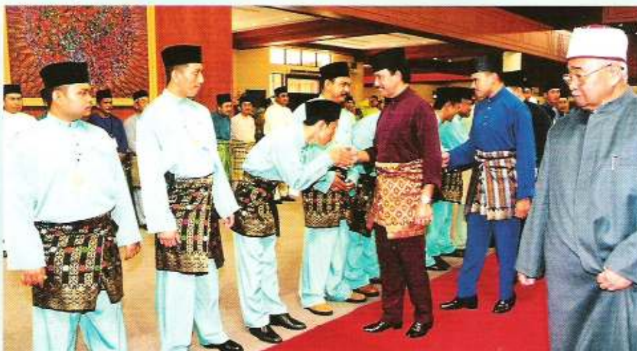
Kebawah Duli Yang Maha Mulia Paduka Seri Baginda Sultan Haji Hassanal Bolkiah Mu'izzaddin Waddaulah, Sultan dan Yang Di-Pertuan Negara Brunei Darussalam berserta anakanda-anakanda baginda berangkat ke Majlis Sambutan Isra' dan Mikraj 1422 di Pusat Persidangan Antarabangsa, Berakas.

Tema sambutan Isra' dan Mikraj tahun 1422 / 2001 ialah Maju Bangsa, Sejahtera Negara Berlandaskan Ajaran Islam.