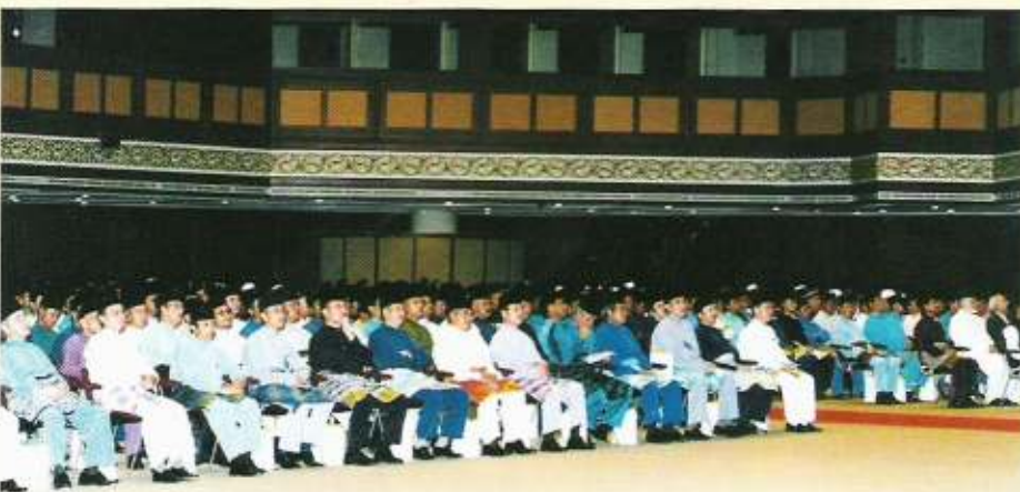
Sebahagian daripada jemputan yang hadir di Majlis Sambutan Nuzul al-Qur'an yang berlangsung pada 17 Ramadhan 1422 bersamaan 7 November 2001.