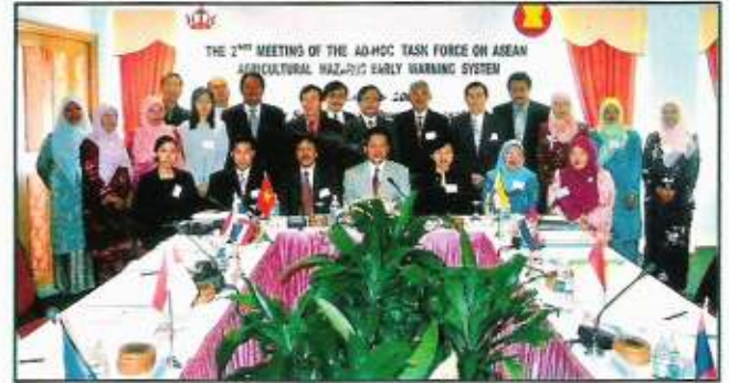
Gambar ramai delegasi-delegasi dari Negara-Negara ASEAN bersama Pengarah Pertanian

penyakit-penyakit yang amat berjangkit. Dalam keadaan semasa yang membimbangkan dengan kemunculan dan kebangkitan virus yang amat berjangkit, sistem waspada AHEWS boleh mengukuhkan lagi keadaan bio-keselamatan dan sistem maklumat kesihatan haiwan di ASEAN.