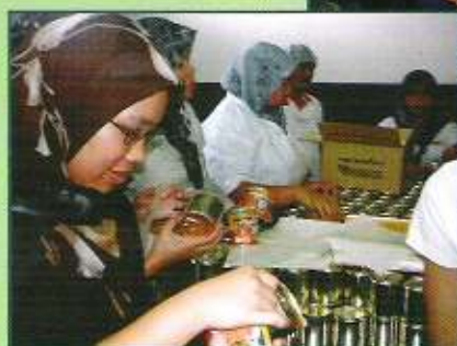
Lawatan ke kilang pengetinan Sabli Foods Sdn. Bhd.

kualiti yang sebanding atau pun lebih baik daripada produk-produk import dengan harga yang kompetitif.