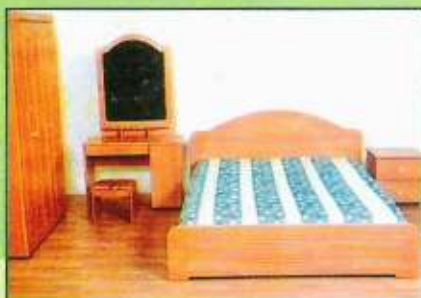
Fashion Furniture and Construction Company Sdn. Bhd.

Syarikat ini adalah merupakan syarikat pengeluar perabot yang utama di negara ini. Di samping itu syarikat ini juga bergiat aktif menyertai program-program promosi eksport anjuran KPSU bagi menembusi pasaran luar negeri seperti Jepun dan lain-lain.