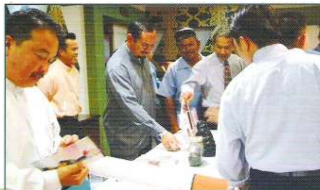
Pegawai dan kakitangan KPSU dan jabatan-jabatan di bawahnya sedang menyaksikan pameran

Kempen berkenaan antara lain bertujuan mempertingkatkan dan memperkukuhkan tindakan bersepadu agensi-agensi kerajaan dalam usaha membanteras penggunaan tembakau, rokok dan merokok selain mempertingkatkan lagi kesedaran di kalangan orang ramai mengenai bahaya rokok dan merokok, menghindarkan diri dari mula merokok, kesan rokok dan merokok terhadap perokok pasif.