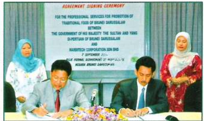
Pengarah Pertanian Yang Mulia Dr Haji Mohamad Yussof bin Haji Mohiddin di majlis menandatangani perjanjian

Projek konsultasi ini akan dijalankan selama tiga tahun dan akan melibatkan tiga fasa aktiviti. Fasa pertama akan melibatkan aktiviti-aktiviti seperti mengadakan kaji selidik status makanan asli di Negara Brunei Darussalam, mengenal pasti makanan asli tempatan yang berpotensi untuk dikembang maju, mengadakan bengkel teknologi pemprosesan dan pembungkusan moden dan menilai operasi pelaksanaan aktiviti-aktiviti sains dan teknologi makanan di Unit Lepas Tuai dan Teknologi Makanan, Jabatan Pertanian dan seterusnya membuat cadangan yang membolehkan Unit tersebut mengembangkan kecekapan