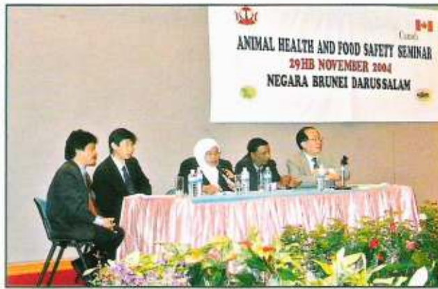
Ahli-ahli panel Seminar Kesihatan Haiwan dan Keselamatan Makanan

Yang Mulia Dato Paduka Awang Haji Idris bin Haji Belaman, Setiausaha Tetap KPSU dalam ucapan perasmianya selaku Tetamu Kehormat di Seminar Kesihatan Haiwan dan Keselamatan Makanan yang berlangsung di Dewan Setia Pahlawan, KPSU pada 29 November 2004 menyatakan bahawa Brunei Darussalam adalah bebas daripada wabak penyakit utama ternakan serta lain-