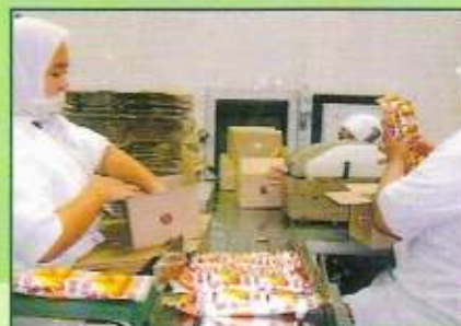
Kingston Beverage and Creamery Sdn. Bhd.