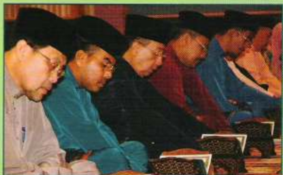
Yang Berhormat Menteri Perindustrian dan Sumber-Sumber Utama hadir selaku Tetamu Kehormat majlis