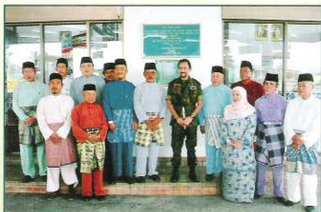
Kebawah Duli Yang Maha Mulia berkenan bergambar ramai dengan ahli-ahli jawatankuasa Syarikat Kerjasama Pegawai-Pegawai dan Kakitangan Kerajaan Kuala Belait (SEPAKAT)

Di akhir majlis keberangkatan Kebawah Duli Yang Maha Mulia ke Koperasi SEPAKAT, Baginda telah berkenan menerima junjung ziarah dari ahli-ahli Lembaga Pengarah dan jawatankuasa dan ahli-ahli koperasi.