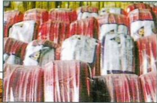
L.K.H. (B) Sdn. Bhd.

Mengikut kajian yang dibuat pada tahun 2000 bagi peringkat pekerja tidak mahir (buruh), kadar bilangan pekerja tempatan ketika ini masih terlalu rendah iaitu pada kadar 7%. Di kalangan pekerja mahir dan separuh mahir pula kadar bilangan pekerja tempatan adalah di tahap yang menggalakkan iaitu kira-kira 60% di peringkat mahir dan 52% di peringkat separuh mahir.