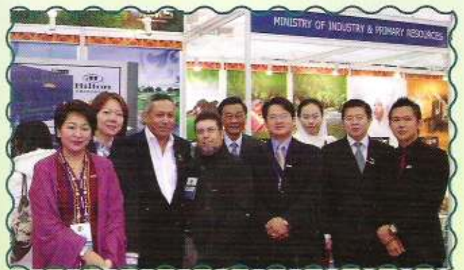
Gambar ramai Pengarah Kemajuan Pelancongan bersama peserta pameran

kedudukan negara ini sebagai destinasi pelancongan selaras dengan pengiktirafan Kerajaan Republik Rakyat China kepada Negara Brunei Darussalam sebagai approved tourist destination bagi pelancong-pelancong China.