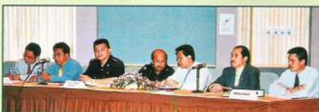
Pegawai-pegawai kanan dari agensi-agensi kerajaan yang terlibat dalam menyampaikan taklimat

Taklimat tersebut telah dihadiri oleh kira-kira 100 orang peserta yang terdiri daripada pengurus-pengurus kilang papan di seluruh negara, ketua-ketua kampung dalam kawasan yang terlibat, pemandu-pemandu lori balak dan juga kakitangan Jabatan Perhutanan yang terlibat secara langsung dalam mengawal dan memantau operasi pembalakan. Taklimat berakhir dengan sesi soal jawab antara para peserta dengan wakil-wakil dari jabatan-jabatan berkaitan.