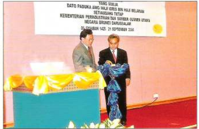
Yang Mulia Setiausaha Tetap KPSU di Majlis Pelancaran Logo Pemeriksaan Veterinar dan Pelancaran Buku

Beliau seterusnya menambah, dalam usaha menganjukkan sektor pertanian menjurus ke arah dorongan pasaran agribisnes, Jabatan Pertanian menumpukan perhatian