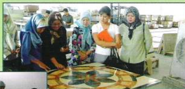
Penuntut-penuntut penempatan menyaksikan pembuatan marble di Syarikat Oriente Sdn. Bhd.

Lawatan ini adalah merupakan pengalaman pertama bagi penuntut-penuntut tersebut ke tapak-tapak perindustrian di negara ini dan merasa kagum dengan kegiatan-kegiatan dan hasil-hasil yang dikeluarkan sejak sekian lama. Hasil dari peninjauan tersebut ternyata perusahaan-perusahaan tempatan bukan sahaja berkemampuan menjalankan kegiatan-kegiatan perkilangan berkenaan tetapi juga berjaya menghasilkan produk-produk yang mempunyai