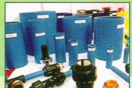
Polyolefins Pipe (B) Sdn. Bhd.