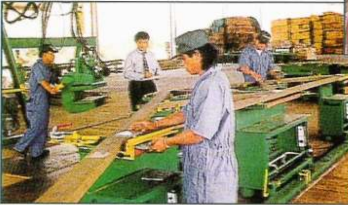
Twinwood Kiln Dry Treatment Industries Sdn. Bhd.

Twinwood Kiln Dry Treatment Industries Sdn. Bhd. menghasilkan bahan kayu berkualiti melalui penggunaan teknologi terkini dalam pengeringan dan pengawetan papan. Loji pengeringan dan pengawetan papan milik syarikat ini di Tapak Industri Serampang, Tutong mampu menghasilkan produk papan berkualiti tinggi sebanyak 55,000 cubic meter setahun.