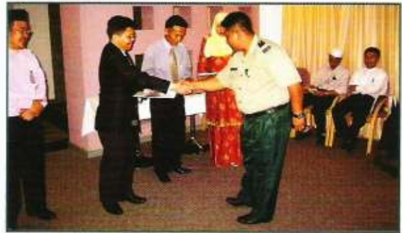
Yang Mulia Pengarah Pengurusan dan Kewangan ketika menyampaikan Sijil Penyertaan kepada salah seorang peserta kursus