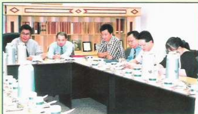
Sebahagian dari pengusaha-pengusaha yang hadir di majlis perjumpaan

Penubuhan jawatankuasa-jawatankuasa kemajuan tapak-tapak perindustrian ini akan dilartakan seterusnya ke tapak-tapak perindustrian di seluruh negara. Seramai kira-kira 19 pengusaha-pengusaha Tapak Perindustrian Salar telah menghadiri perjumpaan tersebut.